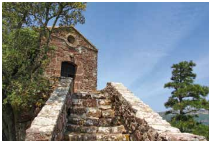
Accés a Santa Bàrbara

Km 3,11 > El poble ens queda a mà dreta, penjat del vessant, però la ruta continua recta per la carretera principal. Deixant enrere una granja avícola, al costat mateix del cementiri, abandonem l'asfalt per desviar-nos a l'esquerra per una pista que ens porta