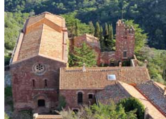
Escornalbou des de Santa Bàrbara