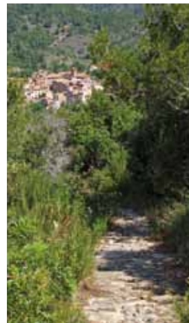
Camí empedrat de l'Argentera

Km 7,33 > El castell d'Escornalbou ens convida a emprendre un apassionant viatge a través de la història. Íbers, romans i sarraïns establiren aquí un bastió defensiu que va anar creixent segle rere segle. En passar a mans cristianes després de la Reconquesta, el castell esdevingué un monestir. D'aquella època, ha arribat als nostres