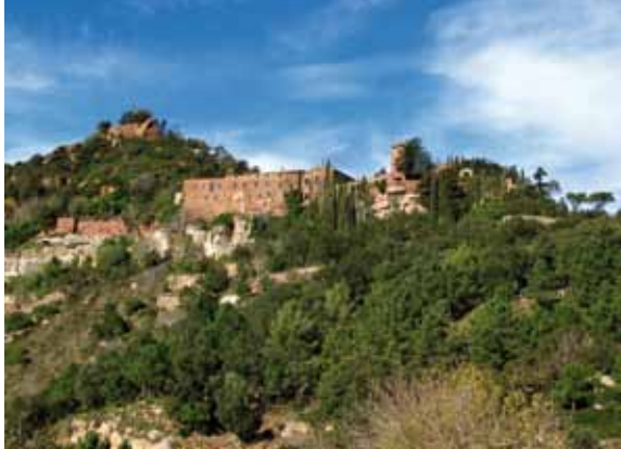
< Vista general del castell

fins als rentadors, molt ben conservats, s'ha de dir. Un minut més tard arribem a un encreuament al costat d'un bosc de xops. La pista de formigó segueix a l'esquerra, a la recerca del castell d'Escornalbou, però nosaltres hem de seguir de front per un caminet de terra que ressegueix el riu. Es tracta de l'antic Camí Reial de Duesaigües a l'Argentera. Les seves cases no tardaran en aparèixer a la llunyania. Les bifurcacions se succeeixen, però el poble ens serveix de referència, no hem de fer més que seguir recte, entre cultius i marges.