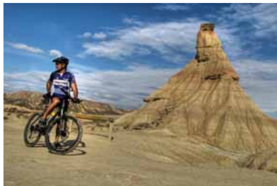
El ciclista espera al pelotón

Km 24,65> Después de dejar el monte Piskerra a la izquierda, un suave descenso nos acerca a las inmediaciones de la cabaña La Coneja. Como un espejismo en los días de verano, surge en el lado izquierdo de nuestra