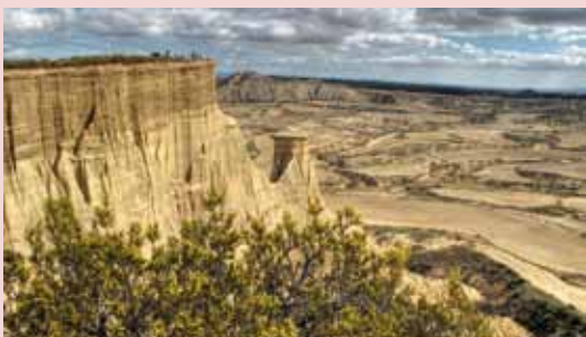
Los cabezos despuntan desafiantes

Al pie de la montaña, a 1,40 km de la pista principal, un camino sinuoso nos introduce rápidamente en un mundo de arcilla casi irreal. Aquí se pierden todas las referencias visuales hasta localizar, según se avanza cañón adentro, en el lado derecho, una angosta escalinata que gana altura entre hermosos picachos pintados, a través de los años, por la caprichosa historia geológica de las Bardenas Reales. En lo alto, un breve desvío invita a tomarse un respiro sobre la torre de vigía que se yergue frente a la cima del Piskerra. Excelentes vistas, quizá las más espectaculares de la ruta, nos aguardan en este accesible otero. Después, sólo queda retomar el camino en dirección a la evidente cumbre. Una pequeña trepada por la roca desnuda nos deja al pie del Piskerra y atacamos los últimos desniveles de la ascensión por una pared quebrada. Este sencillo paseo no lleva más de 45 minutos (ida y vuelta).