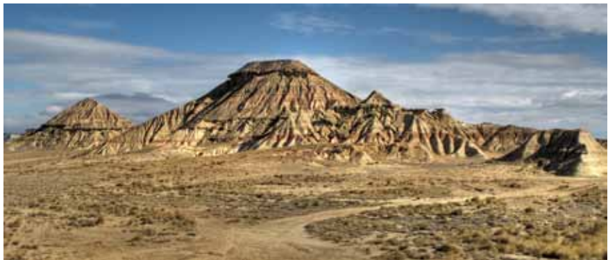
Un paseo lunar nos aguarda en Bardenas

Km 13,95 > El desvío a la izquierda se dirige a la base del monte Piskerra. Un complemento excelente para la excursión es ascender a pie a este picacho de apenas 500 metros (ver recuadro explicativo) con el fin de disfrutar de una vista panorámica de 360° que domina gran parte de las Bardenas.